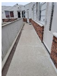
Zo kan het ook!